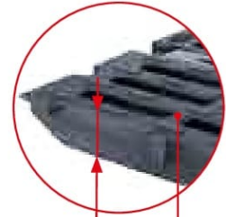
Решітка D 400