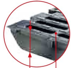
Решітка F 900 KTL покриття